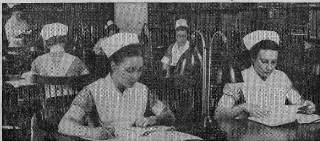
Parte esencial de curso de enfermería es el estudio. Una enfermera graduada los hace completos en química, biología, fisiología, nutrición y ciencias afines. Arriba nos vemos preparando sus respectivos temas en la biblioteca del hospital.